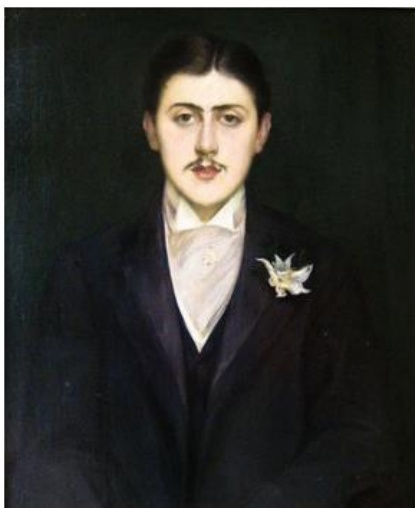
Portrait de Marcel Proust, Jacques-Emile Blanche, 1892 | Musée d'Orsay @Domaine public