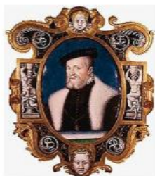
Léonard Ier Limosin, Anne, duc de Montmorency, 1556, Émail, (Musée du Louvre, Paris)