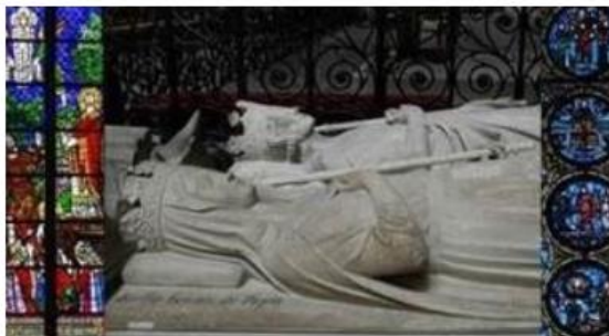
À gauche : Vitrail (détail) Milieu : Basilique St Denis, Gisant de Pépin le Bref et Bertrade de Laon Autres vitraux de la basilique St Denis (détail de médaillons), Abbé Suger, XII e siècle