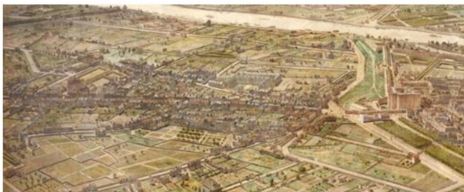
Fedor Hoffbauer, Le faubourg Saint-Antoine vu à vol d'oiseau depuis le nord, tel qu'en 1789 (détail)