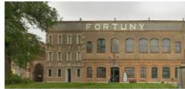
Fortuny manufacturing on Fondamenta San Biagio on the Giudecca Island in Venice

Mariano Fortuny installe ses ateliers sur l'île de la Giudecca à Venise en 1919. Un siècle plus tard, les tissus qu'il a imaginés y sont toujours fabriqués.