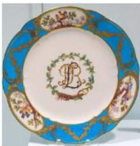
Dessert plate, Prince de Rohan Service, 1773, Kramfort Art Museum, LUXE