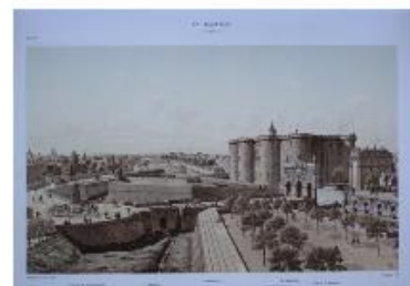
Theodor Josef Hubert Hoffbauer, La Bastille , 1740