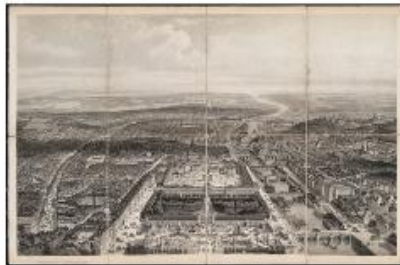
Testard, Aspect général de Paris , 1860. Vue aérienne de la rue de Rivoli avant le prolongement à l'est de la rue de Robespierre