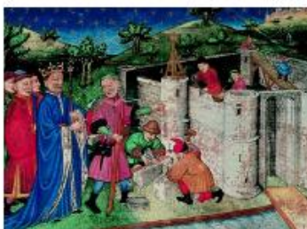
Antoine, Créateur de la Bastille [Bastille parisiennes, le maître d'ouvrage Jean-Baptiste de Launay (1711) son chambellan Le Flaconne, en rouge, et (à) le Cœur de la Bastille]