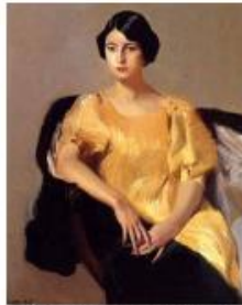
Josephine Bonaparte, by the artist Jean-Baptiste Isabey, circa 1804 Musée de la Ville de Paris, Paris