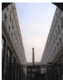
La tour des Écouys (n° 27, rue du Faubourg-Saint-Antoine)