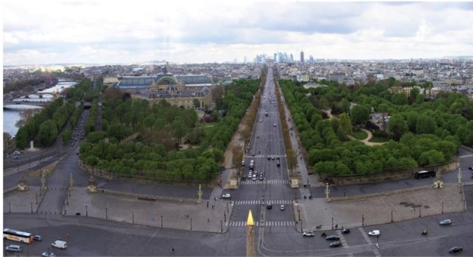
Avenue des Champs-Élysées (Paris) vue haut de la grande roue de la Concorde