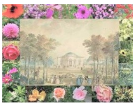
Jean-Benoît-Léon Dugès, The Gardens of Bagatelle, 1779 | New York Museum of Modern Art @ Paris, Dugès,

Le Parc de Bagatelle a été créé par le Comte d'Artois en 1775. L'architecte François-Joseph Bélanger l'a conçu et Thomas Blaikie, un jardinier écossais, en a assuré la réalisation dans le style anglo-chinois en vogue à l'époque. D'une surface de 24 hectares, le parc est constitué de divers jardins et massifs de fleurs annuelles ou vivaces, d'espaces aquatiques avec grottes, petits ponts, cascades, nénuphars ou nymphéas, sans oublier un couvert aux arbres majestueux. La création de la célèbre