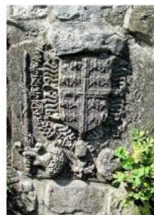
Évê (Olivé), Blason du connétable Anne de Montmorency, en bas du petit port sur le ru du Longsau, rue du Port | @https://commons.wikimedia.org/wiki/CC-BY-SA.3.0