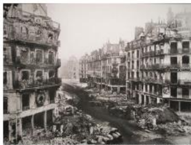
La rue de Rivoli (vers l'hôtel de Ville au niveau de la rue Saint-Martin) après les combats et les incendies de la Commune, Paris 4e arr.