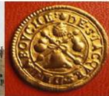
Méreau de cuivre uniface DE. S. IACQUES DE LABOUCHE[R]IE | inist.fr @ Frelin (CNRUMMA). [Le méreau permettait de contrôler l'assiduité des chanoines aux offices.]