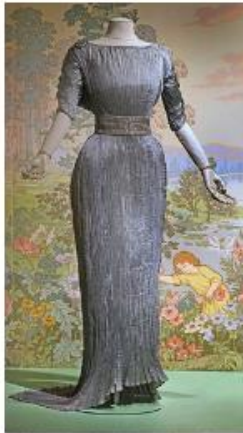
The De physio dress design developed by Fortuny

Visite de l'exposition sous la conduite de Laetitia Pierre