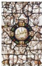
Écouen, Chiffre d'Anne de Montmorency