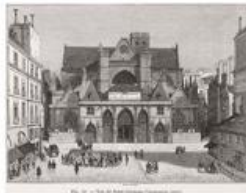
Theodor Josef Hubert Hoffbauer, Saint-Germain l'Auxerrois, 1834