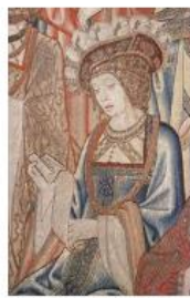
Tapisserie de David et Bethsabée (détail), Bruxelles ± 1510-1520