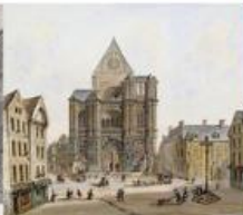
Anonyme, Ancienne façade de l'église Saint-Eustache à Paris, XVII e | Musée Carnavalet, Paris @ Domaine public