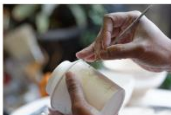
Garrinage, au grand atelier (téléscope et garrinage) de la manufacture nationale de Sèvres